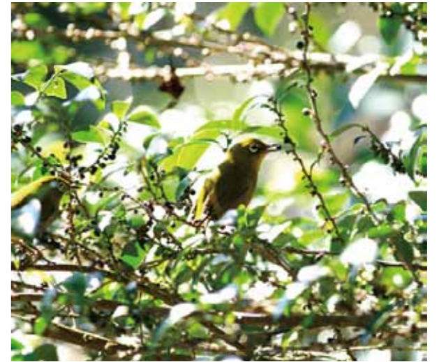
ヒサカキの実を食べるメジロ

今号特集では、みどり森の鳥たちのお気に入りの木の実を紹介します。ぜひご覧ください。