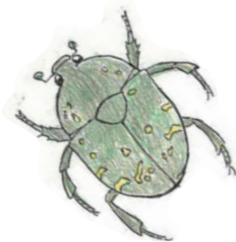
【シラホシハナムグリ】